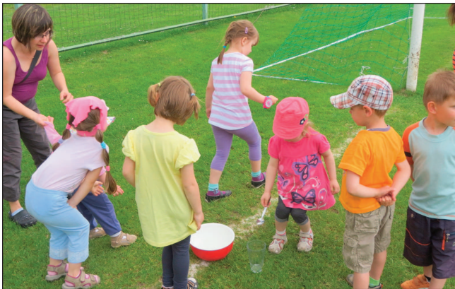
Děti při jedné z disciplín