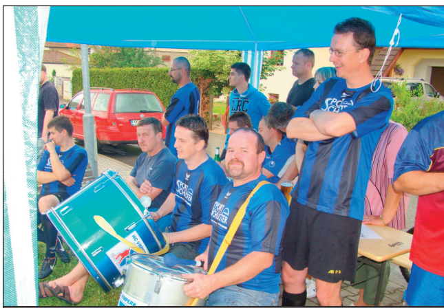
Fanklub mužstva Tatíků