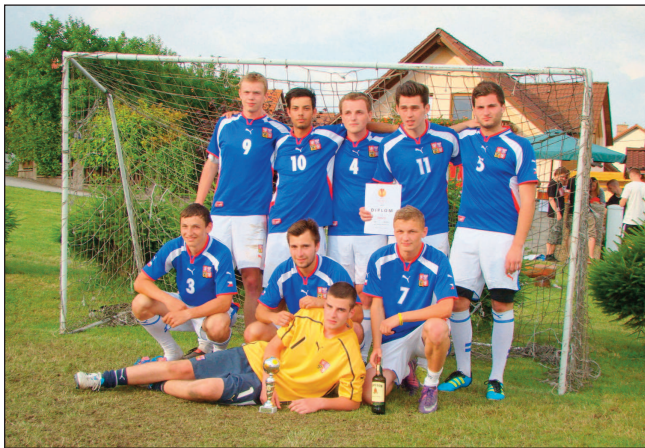
Vítězný tým TRIVIS